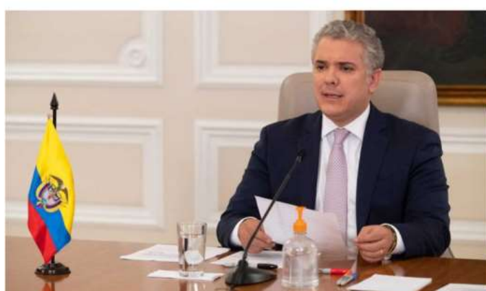
El Presidente Iván Duque comentó este viernes en el programa televisivo 'Prevención y Acción' que el Gobierno radicó en el Congreso un proyecto de ley para extender el Programa de Apoyo al Empleo Formal (PAEF) hasta diciembre próximo.

En una carta enviada al presidente Iván Duque, más de 40 reconocidos ambientalistas se unieron para solicitarle su ayuda para que el Congreso de la República ratifique el Acuerdo de Escazú, pues ni siquiera le han dado un primer debate. (Lea Encuentran 60 ballenas varadas en la costa de Sri Lanka)