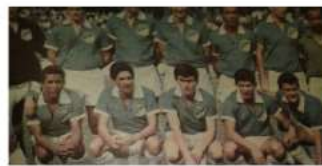
Los comienzos del Deportivo Cali