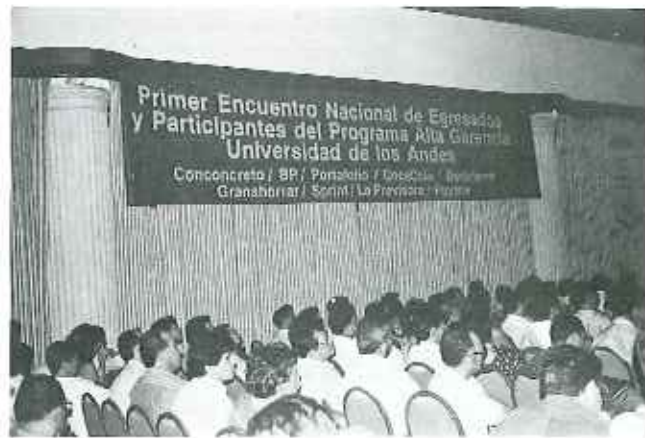
Asistentes al Primer Foro Nacional de Egresados y Participantes en el Programa Alta Gerencia de Uniandes.

El sábado 25 de febrero se realizaron sesiones sobre la gestión municipal exitosa, el café, la industria petrolera y los medios de comunicación. Así mismo se llevó a cabo la presentación de experiencias de algunas de las empresas privadas exitosas del país: Carvajal, Corona, Leonisa, Xerox de Colombia y Productos Roche.