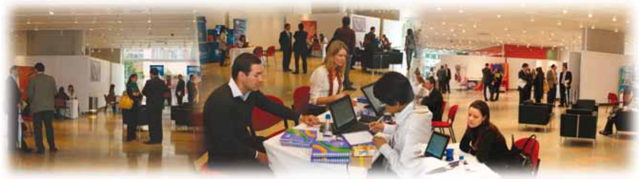
Momentos de la IX Feria Laboral de MBA