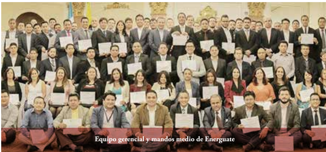
Equipo gerencial y mandos medio de Energuate

Durante tres años, el equipo gerencial y los mandos medios de Energuate, empresa de energía en Guatemala, participaron en el Programa de Formación en Habilidades Directivas, dictado por Educación Ejecutiva. Durante julio, los ejecutivos recibieron entrenamiento personalizado en gestión de las organizaciones, resiliencia organizacional, pensamiento estratégico, toma de decisiones, liderazgo, trabajo en equipo y desarrollo de capacidades de emprendimiento interno. Cursos de desarrollo de competencias de