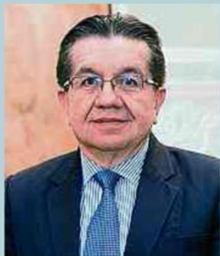
Fernando Ruiz, ministro de Salud, recibió el Premio Especial, en el frente médico.